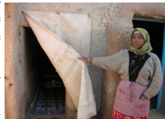
Ci-dessus, une des familles marocaines du village de Khamlia ayant bénéficié de l'installation de sanitaires.

Nous vous donnons donc rendez vous dans notre prochain journal.