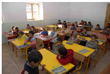
Ecole maternelle d'Ibakaliwane