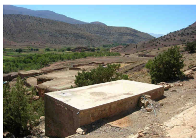
Château d'eau d'Ibakaliwane

Partenaires : Caisse des Dépôts et Consignations et l'Association Aït Ayoub pour le Développement