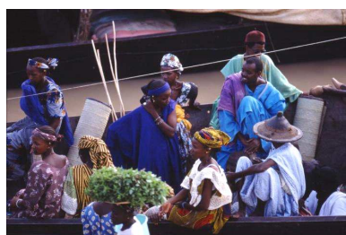
Port de Mopti

Hébergement : Les conditions d'hébergement dans certains villages sont rudimentaires : couchage à la belle étoile ou dans des cases (matelas fournis par Vision du Monde), douche au seau et WC à la turc. En ville, hôtels locaux.