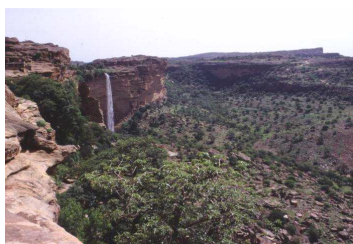
Falaise de Bandiagara

superbement situées. Un sentier au fond d'un petit vallon nous ramène sur le plateau.