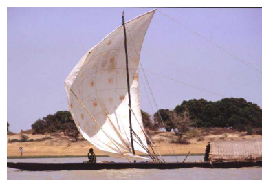
Pinasse à voile