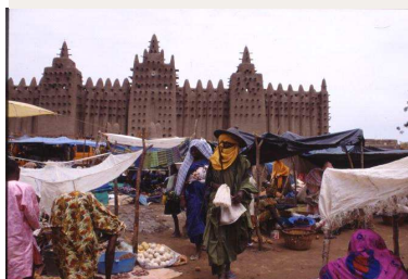
Mosquée de Djenné

Ce voyage permet de découvrir les principaux points d'intérêt du Mali. Les grandes cités maliennes construites sur les rives du fleuve Niger, Djenné et sa mosquée, Bamako « l'Africaine » et Mopti « la Venise malienne », contrasteront avec la vie rurale du Pays Dogon.