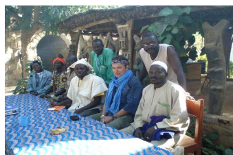
Comité de Koundou

Partenaires : Inter comité d'entreprise ALICES, association Jekabaraton