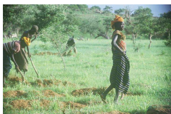
Travaux des champs

Transfert pour Bamako, visite de la ville (musée ethnologique, maison des artisans...). Transfert à l'aéroport, vol pour la France.