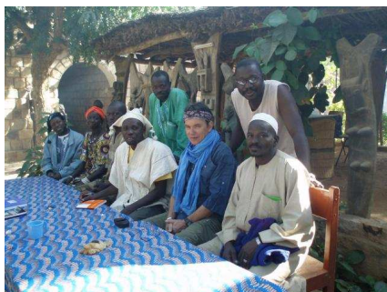
Comité de Koundou

Partenaires : Inter comité d'entreprise ALICES, association Jekabaraton