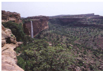
Falaise de Bandiagara