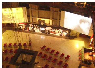
Musée du cinéma

Musique et animation avec la troupe d' Alma Teatro , composée d'immigrés.