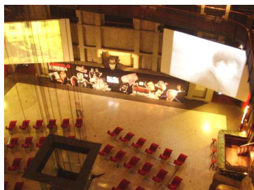
Musée du cinéma

Musique et animation avec la troupe d'Alma Teatro, composée d'immigrés.