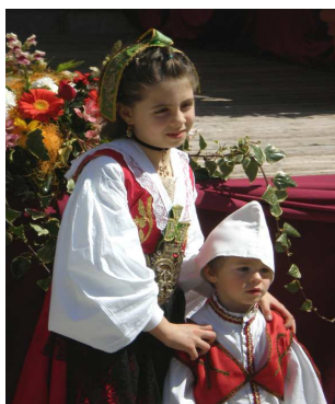
Enfants en costume traditionnel albanais