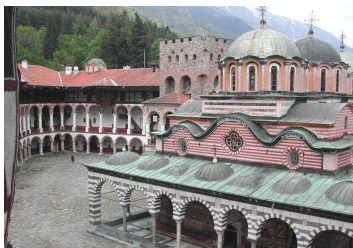
Monastère de Rila