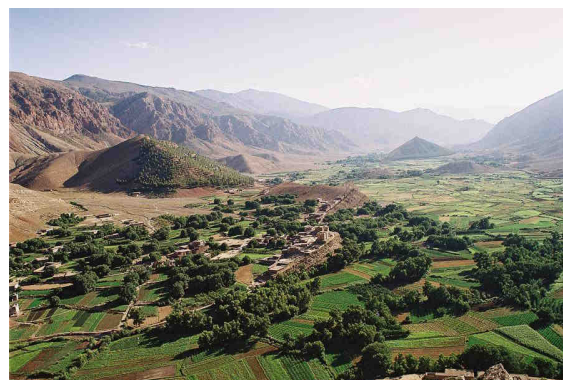
Panorama de la vallée des Aït Bouguemez