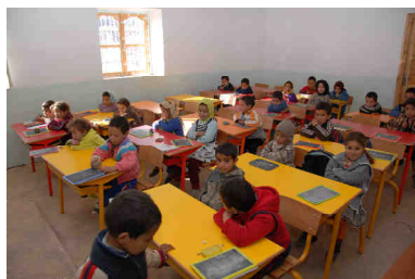
Ecole maternelle d'Ibakaliwane

Les projets, directement proposés par les communautés villageoises ou les associations locales sont analysés et sélectionnés par Vision du Monde au travers d'une grille de 14 critères d'éligibilité conformes à notre charte.