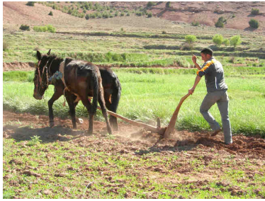
Travaux des champs