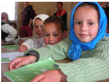
Ecole maternelle d'Ibakaliwane