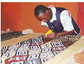
Confection de bogolans maliens

Jour 9 : Transfert pour l'aéroport le matin. Vol Mopti / France.