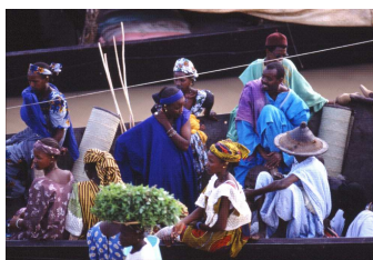
Port de Mopti